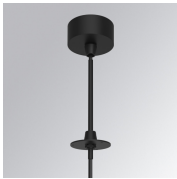
Cód. producto: K71SUCAWI2000DBK K71SUCAWI2000NBK