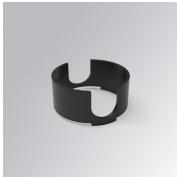
Cód. producto: K71SUADLATBK