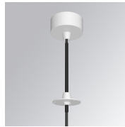
Cód. producto: K71SUCAWI2000DWH K71SUCAWI2000NWH