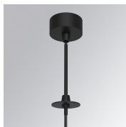
Cód. producto: K71SUCAWI2000DBK K71SUCAWI2000NBK