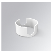
Cód. producto: K71SUADLATWH