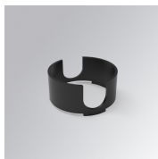
Cód. producto: K71SUADLATBK