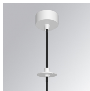
Cód. producto: K71SUCAWI2000DWH K71SUCAWI2000NWH