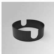
Cód. producto: K11SUADLATBK