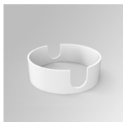
Cód. producto: K11SUADLATWH