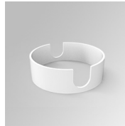
Cód. producto: K11SUADLATWH