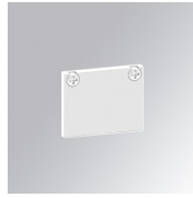
Code produit: TLASUECW

Description: TRACK 48V ACC. END COVER CABLE WH.