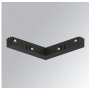
Code produit: TLASULDNB

Description: TRACK 48V ACC. INTM JOINT DALI/ONOFF WH.