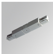
Code produit: TKAAIDNW