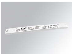
Code produit: TLDRV2015048N

Description: TRACK 48V ACC. X JOINT DALI/ONOFF WH.