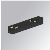
Code produit: TLASUIJDNB

Description: TRACK 48V ACC. END COVER WH.