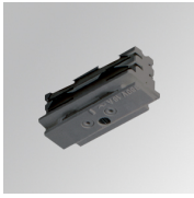
Code produit: TKAJUDNG

Description: TRACK ACC SRT W/O SP JOINT DALI/ONOFF GR