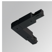
Code produit: TKALODNB

Description: TRACK ACC INT 90° CORNER DALI/ONOFF WH