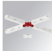
Code produit: TLASUXJDNW

Description: TRACK 48V ACC. X JOINT DALI/ONOFF BK.