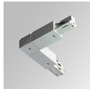
Code produit: TKALODNW

Description: TRACK ACC EXT 90° CORNER DALI/ONOFF GR