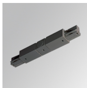
Code produit: TKAAIDNG