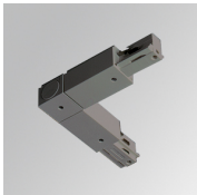
Code produit: TKALODNG

Description: TRACK ACC EXT 90° CORNER DALI/ONOFF BK