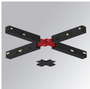
Code produit: TLASUXJDNB

Description: TRACK 48V ACC. 90° CORNER DALI/ONOFF WH.