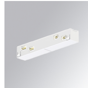
Code produit: TLASUIJDNW

Description: TRACK 48V ACC. INTM JOINT DALI/ONOFF BK.