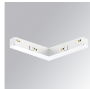
Code produit: TLASULDNW

Description: TRACK 48V ACC. 90° CORNER DALI/ONOFF BK.