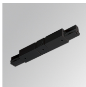
Code produit: TKAAIDNB