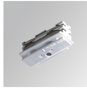
Code produit: TKAJUDNW

Description: TRACK ACC SRT W/O SP JOINT DALI/ONOFF GR