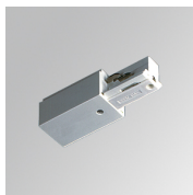
Code produit: TKAARDNW