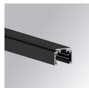
Code produit: TLSUPR1000DNB TLSUPR2000DNB

Description: DRIVER 150W 48V 220-240V NR IND