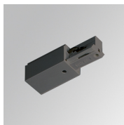
Code produit: TKAARDNG