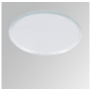
Cód. producto: HSTR50

Descripción: HANCE 1000/2000 ACC. SOFT LENS