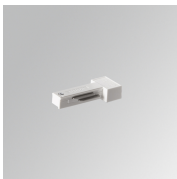
Cód. producto: TLSUARDW