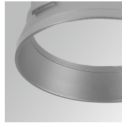
Cód. producto: HSRI65M

Descripción: HANCE 1000/2000 ACC. RING DECO CO.