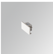
Cód. producto: TLSUECW