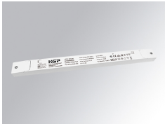
Cód. producto: TLDRV2015048N