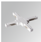
Cód. producto: TLSUXJDW