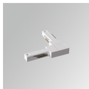
Cód. producto: TLSULODW