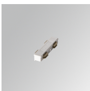
Cód. producto: TLSUIJDW