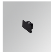
Cód. producto: TLSUECB