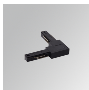
Cód. producto: TLSULODB