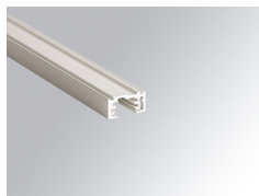
Cód. producto: TLSUPR1000DW TLSUPR2000DW