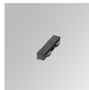
Cód. producto: TLSUIJDB