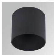
Cód. producto: HSCU50