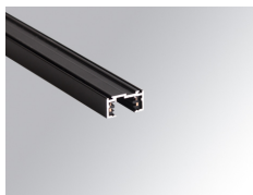
Cód. producto: TLSUPR1000DB TLSUPR2000DB