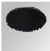
Cód. producto: HSHO50