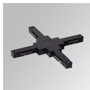
Cód. producto: TLSUXJDB