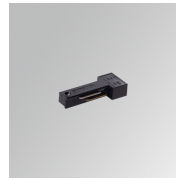
Cód. producto: TLSUARDB