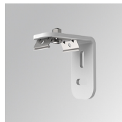
Cód. producto: F3FX50W

Descripción: ACC. WALL BRACKET FIL35 50MM GR.