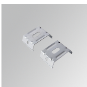
Cód. producto: F3FX15G

Descripción: ACC. CEILING BRACKET FIL35 15MM GR.