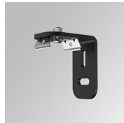
Cód. producto: F3FX50B

Descripción: ACC. WALL BRACKET FIL35 50MM BK.