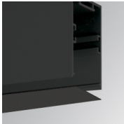
Cód. producto: F3COX/MMB