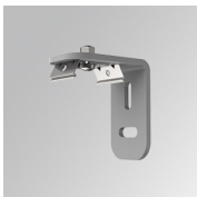
Cód. producto: F3FX50G

Descripción: ACC. WALL BRACKET FIL35 50MM BK.